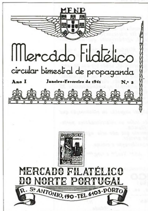
Capa da Revista «Mercado Filatélico, de 1941»

Entretanto, devemos prestar homenagem ao Mercado Filatélico do Norte (MFNP) que